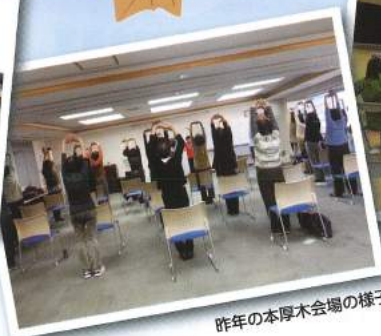
昨年の本厚木会場の様子