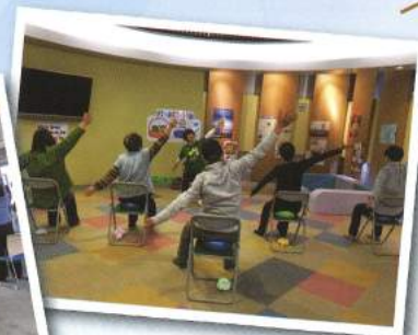
昨年の寒川会場の様子