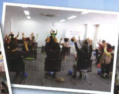
昨年の藤沢会場の様子