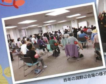
昨年の淵野辺会場の様子

相模原市・厚木市・藤沢市・寒川町の4地域で健康教室を開催します。 講師は専門のインストラクターやトレーニング指導士ら、健康指導のプロが担当いたします。 日頃運動不足の方や、健康に不安のある方など、参加してみませんか。