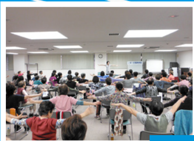
昨年の各会場の様子